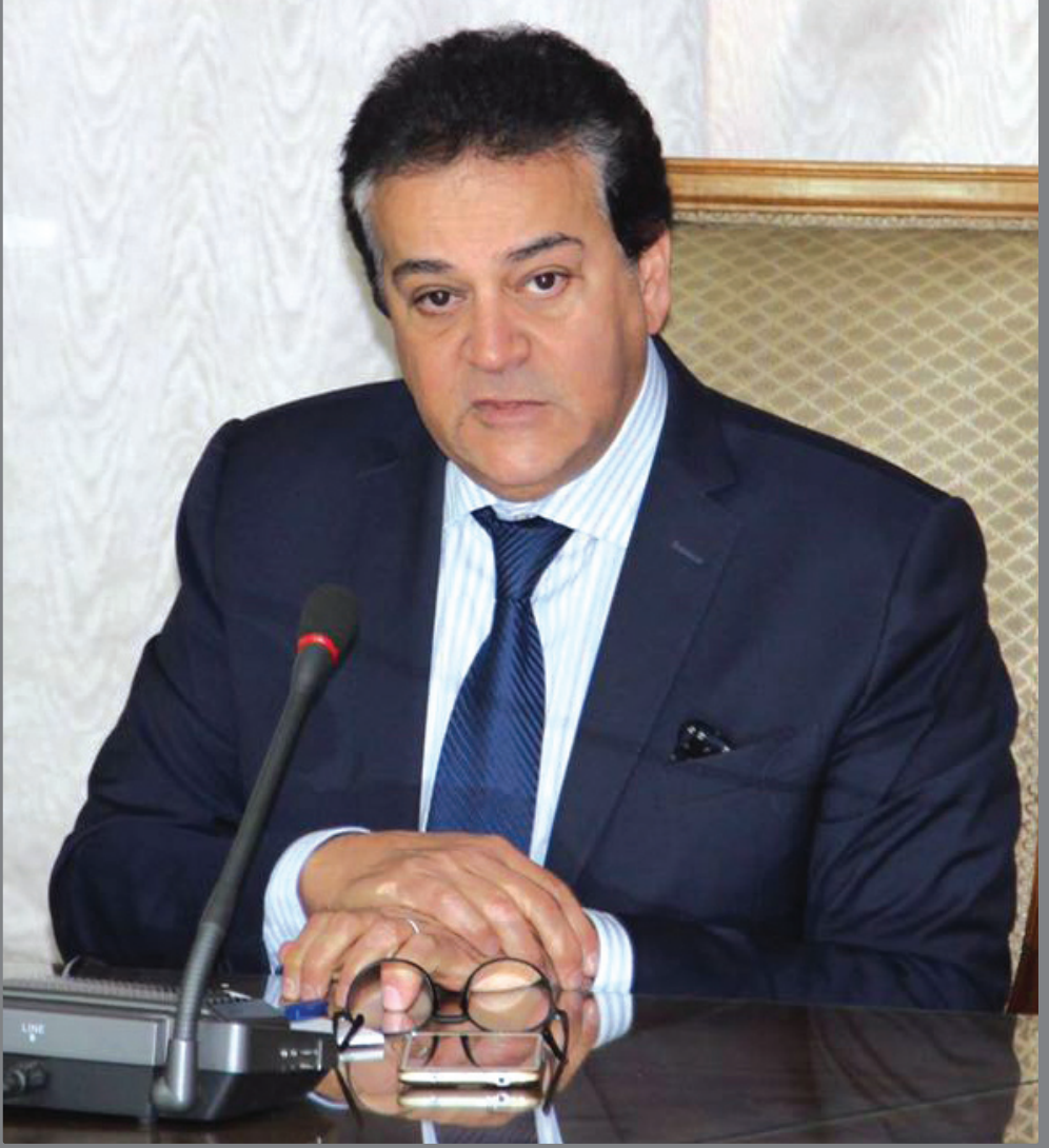
أ. د / خالد عبد الغفار . وزير التعليم العالى والبحث العلمى .